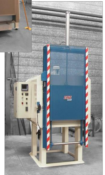
Quelques-uns de nos modèles standard (dimensions spéciales sur simple demande)